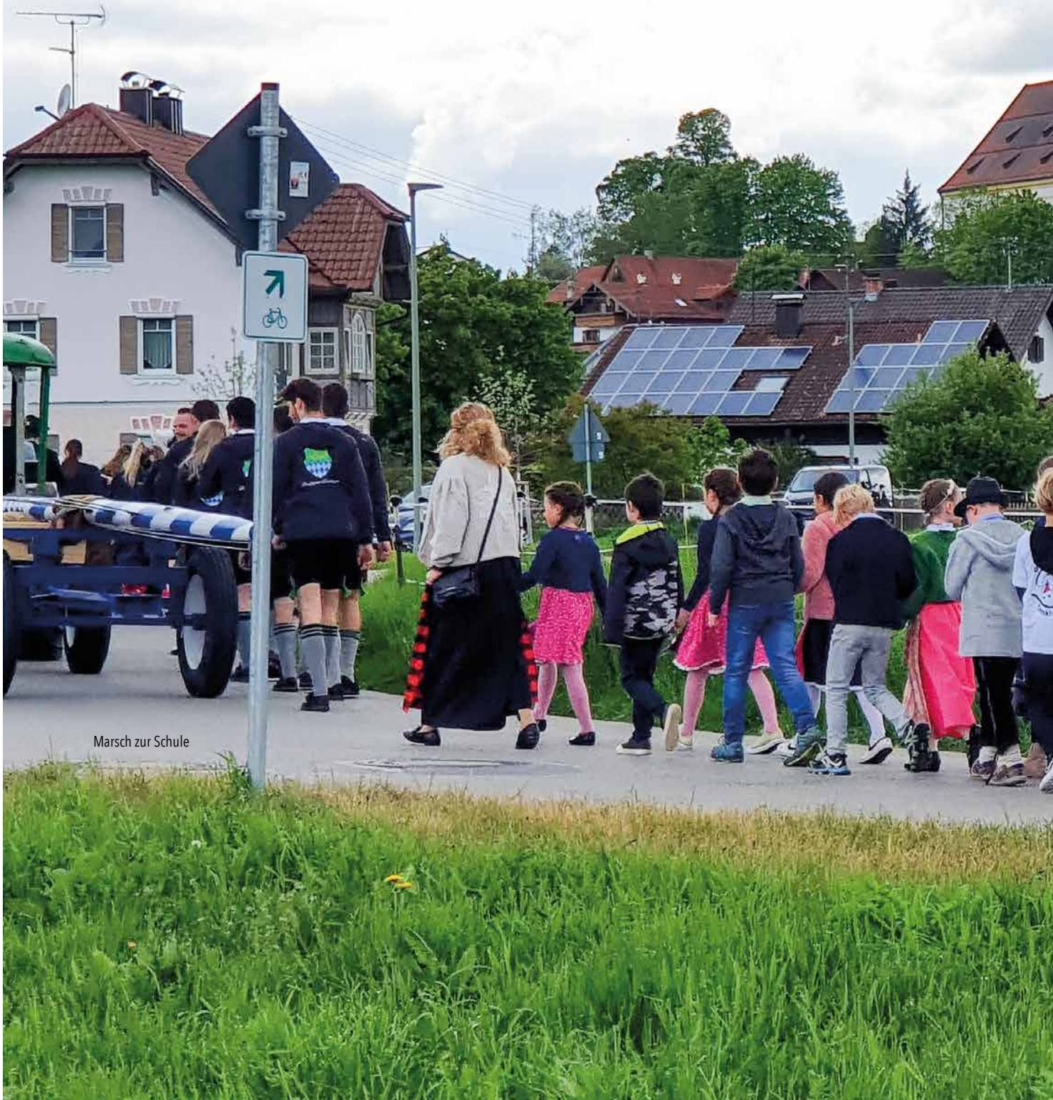
Marsch zur Schule

Alle waren froh, dass es wenigstens nicht regnet!