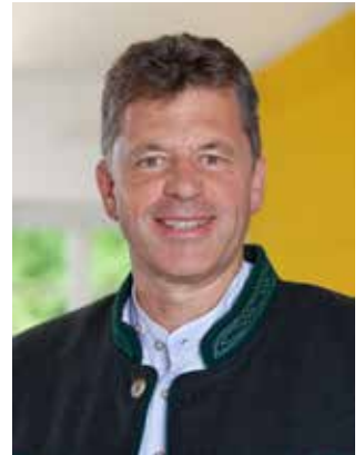
Andreas Braunegger Erster Bürgermeister