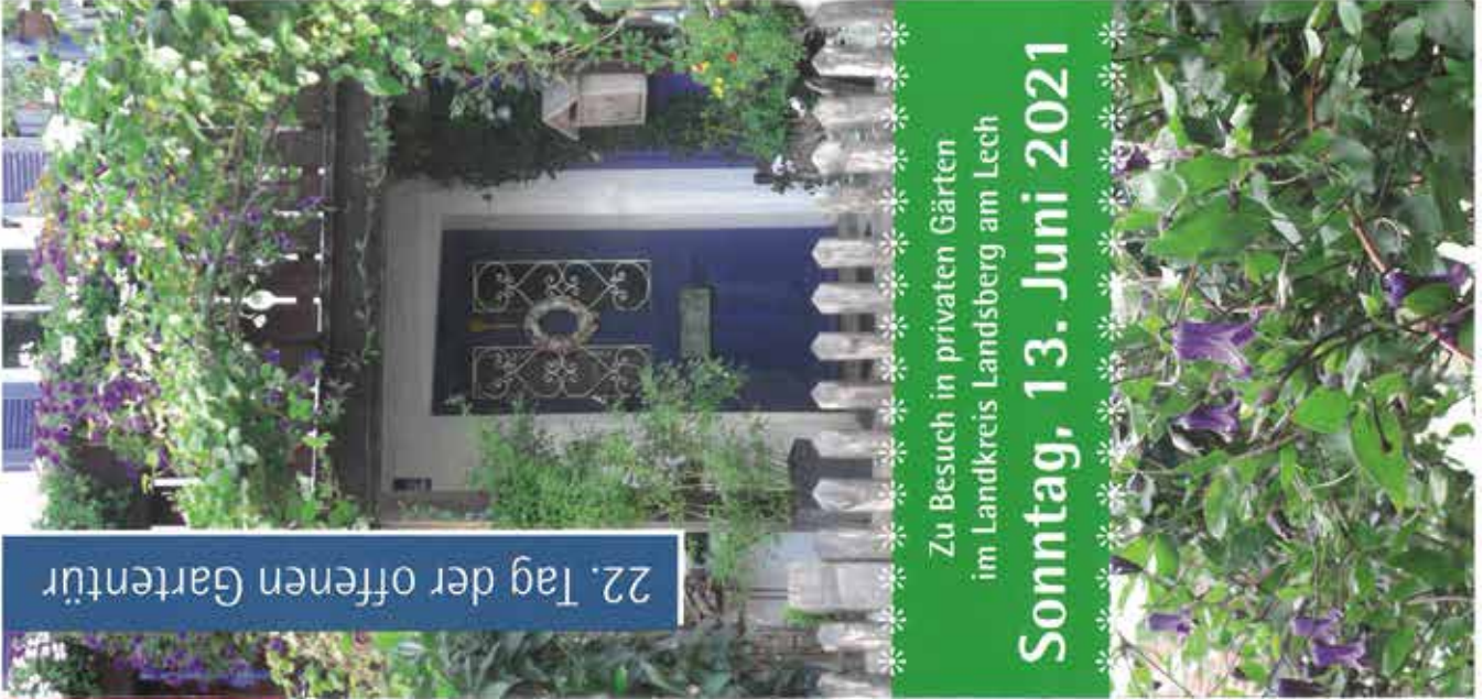
Design: www.nature-offener / Text: Bild: www.vraz-ephratz / Credits: iStock / Getty Images / Adobe Stock / Shutterstock / Zehn / Wotravak / Canistral

Kreisfachberatung für Gartenkultur und Landschaftspflege