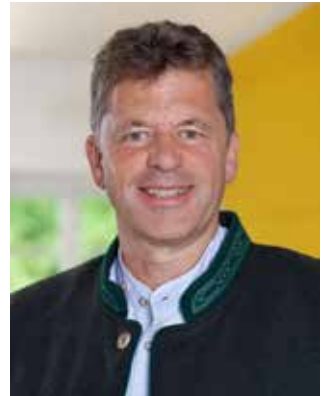
Andreas Braunegger Erster Bürgermeister

Unabhängig vom Ausgang der Vergaben baut momentan die schwaben netz gmbh in Denklingen ihr Gasnetz inkl. Glasfaserleerrohr aus. Ob und in welchem Maße dieses Glasfaserleerrohrnetz genutzt wird, bzw. bei den Ausschreibungen in Betracht kommt, steht zum heutigen Zeitpunkt noch nicht fest. Schön und praktisch wäre natürlich das bereits verlegte Netz zu nutzen.