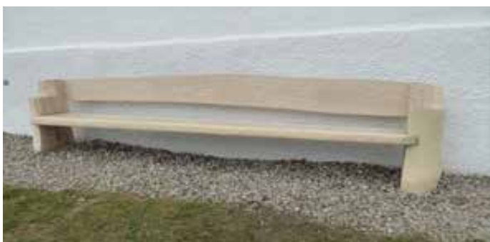
Text und Bild: Toni Draxl