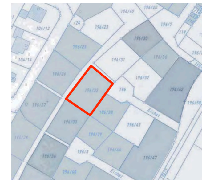
Auszug aktuelle Katasterkarte (Bauplätze verkauft / frei)

Die Grundzüge des früheren, nach wie vor rechtsverbindlichen Bebauungsplanes sind nicht betroffen. Daher kann diese Änderung als vereinfachte Änderung gem. § 13 BauGB durchgeführt werden. Die Zulässigkeit von Vorhaben, die einer Pflicht zur Durchführung einer UVP unterliegen, wird nicht begründet (§ 13 Abs. 1 Nr. 1 BauGB), ebenso liegen keine Anhaltspunkte für eine Beeinträchtigung der in § 1 Abs. 6 Nr. 7 Buchstabe b genannten Schutzgüter vor. Nach Abs. 3 wird daher von der Umweltprüfung nach § 2 Abs. 4, dem Umweltbericht nach § 2 a und von der Angabe nach § 3 Abs. 2 Satz 2 BauGB abgesehen.